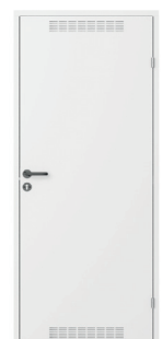
model 2 z wentylacją Biały (RAL 9016)

* Sugerowana cena detaliczna w zależności od opcji: model 1 „pełne” ocynkowane nielakierowane 289 netto 355,47 brutto, model 1 „pełne” lakierowane 340 netto 418,20 brutto, model 2 z wentylacją ocynkowane nielakierowane 299 netto 367,77 brutto, model 2 z wentylacją lakierowane 349 netto 429,27 brutto. Ceny podano w PLN. Firma Porta KMI Poland zastrzega sobie prawo wprowadzenia (bez uprzedzenia) zmian parametrów technicznych, wyposażenia, cen, warunków wydłużonej gwarancji oraz specyfikacji produktów.