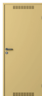
model 2 z wentylacją Kremowy (RAL 1001)