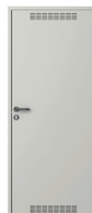
model 2 z wentylacją Popielaty (RAL 7047)