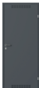
model 2 z wentylacją Antracyt (RAL 7024)

(skrzydło metalowe z zamkiem na wkładkę, ościeżnica metalowa kątowna, klamka z szyldem okrągłym i rozetą)