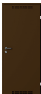
model 2 z wentylacją Brązowy (RAL 8028)